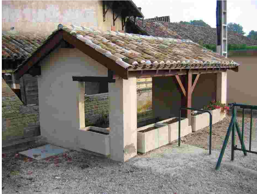
Le lavoir de Guéreins

Le lavoir de Guéreins est situé en bordure de la voie principale du village, juste à côté du bief de dérivation qui alimentait le moulin Bernard. Il marque l'entrée vers la zone de loisirs et ses terrains sportifs et jouxte la zone de stationnement attenante. Son environnement proche est très minéral avec les terrains sportifs en stabilisé et le parking en concassé.