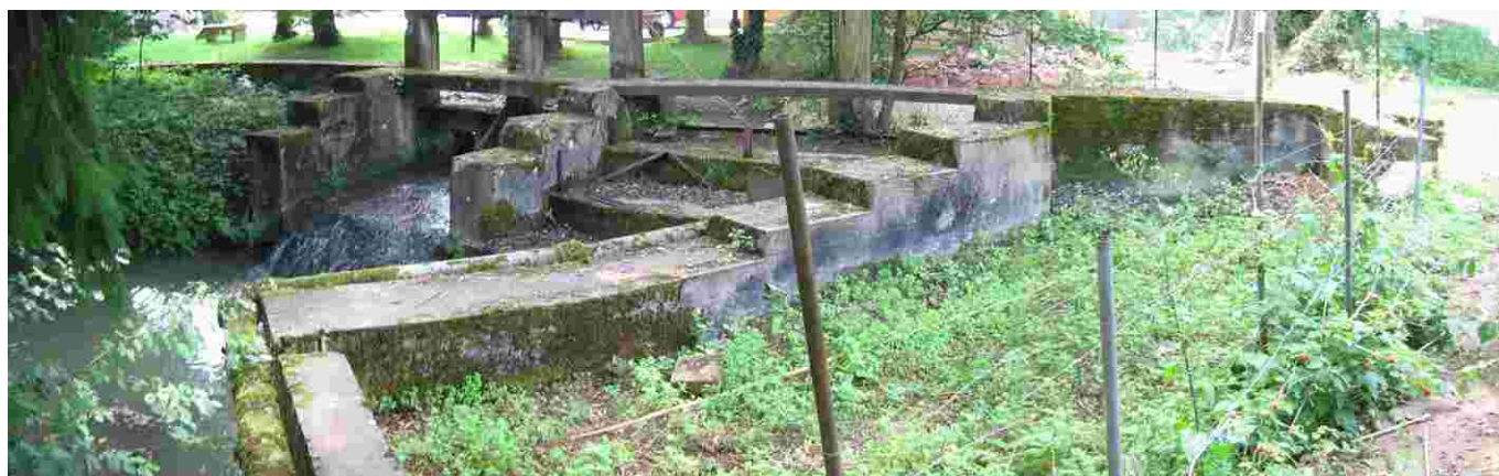
Les vannes d'alimentation de la pisciculture et le bassin d'élevage au premier plan

La commune de Guéreins possède des vestiges d'ouvrages qui ont tenu lieu de pisciculture. Il reste notamment de cette ancienne exploitation, un bassin d'élevage comblé par des déchets de toute sorte, un plan d'eau alimenté par un bief et un système complexe de vannes, qui sont dégradés mais constituent un bel ensemble sous des ombrages très agréables, situé sur un terrain communal.