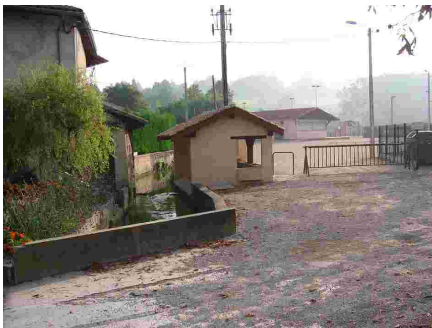
Le lavoir de Guéreins sur le bief du moulin Bernard

La commune de Guéreins possède des atouts patrimoniaux et touristiques indéniables : les milieux humides de la vallée de la Calonne à proximité du village, le lavoir du centre-bourg, les vestiges d'une ancienne pisciculture, et la Calonne et son bief de dérivation qui alimentait l'ancien moulin Bernard.