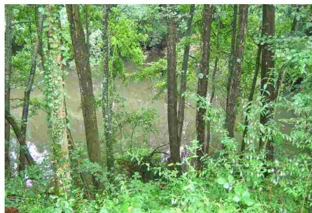
Les berges pentues et boisées du plan d'eau

Une ancienne gravière jouxte le parc municipal de Saint-Etienne-sur-Chalaronne, elle pose des problèmes de sécurité du fait de sa localisation et ses berges très pentues envahies par un taillis touffus. Avant tout autre valorisation imaginable en tant que plan d'eau de loisirs, il y a une nécessité de sécuriser ses abords pour éviter la chute dans ce plan d'eau aujourd'hui accessible et à proximité directe d'espaces publics très fréquentés.