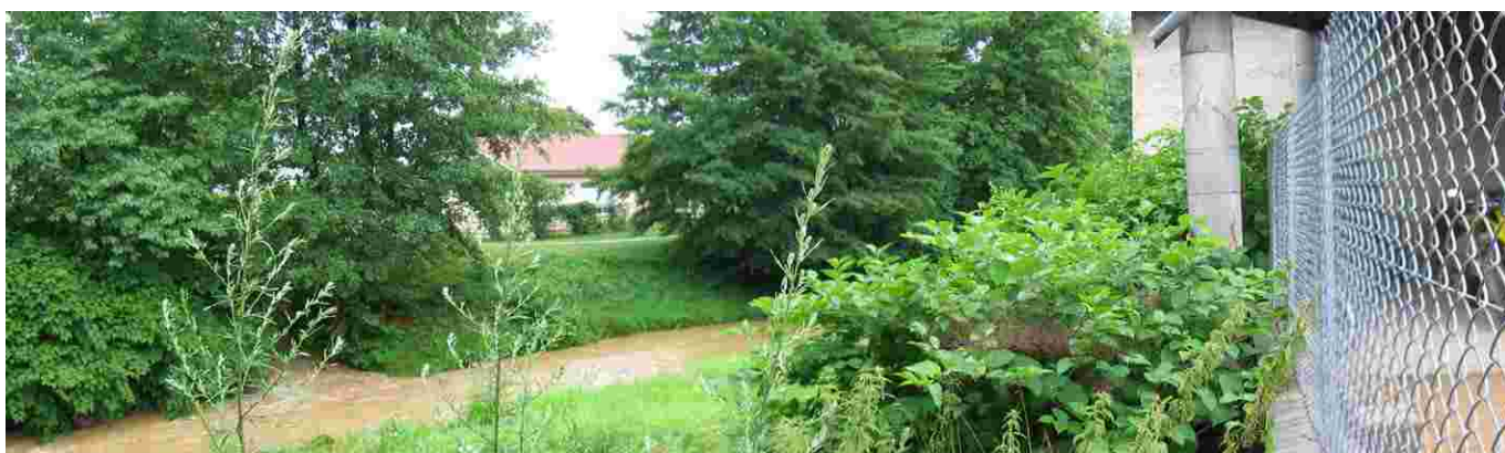
Les berges de la Chalaronne à l'arrière des ateliers municipaux

Ce chemin permettra ainsi de rejoindre agréablement le parc municipal et les sentiers en bordure de Chalaronne en suivant les berges à l'arrière des ateliers municipaux.