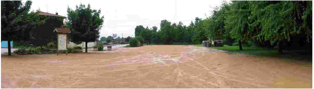
L'actuelle zone de stationnement en entrée de bourg

Cette aire de stationnement en bordure de Chalaronne marque l'entrée dans Saint-Etienne-sur-Chalaronne. Or, on y trouve pêle-mêle des containers, un panneau sur les sentiers balisés, une vaste aire en stabilisé, et une prairie plantée d'arbres sans grande composition apparente. La limite entre la route et cet espace est très floue.