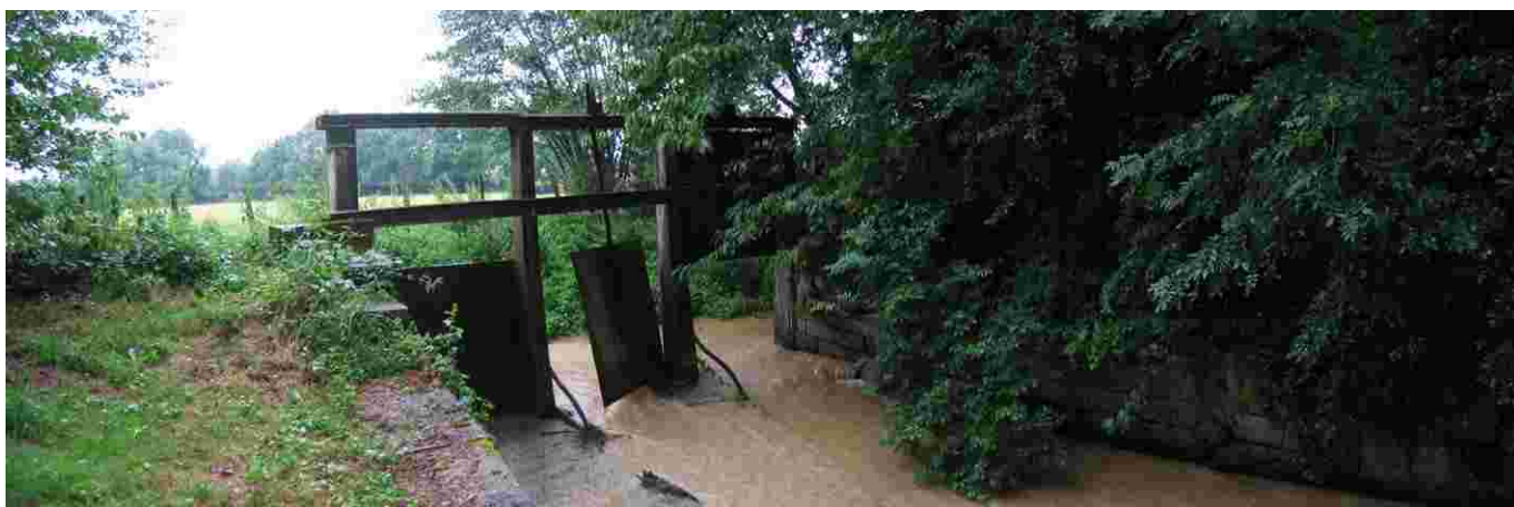
L'ouvrage du bief du moulin du bourg

Les pelles de cet ouvrage en ruine qui menacent de tomber à l'eau devront être ôtées afin d'éviter la création d'embâcles.