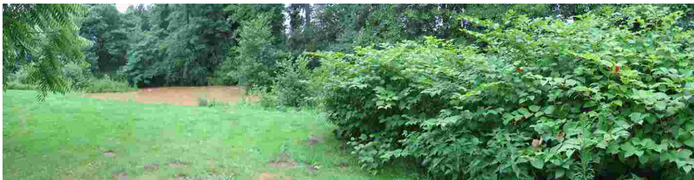
Les berges de la Chalaronne colonisée par la renouée du Japon en bordure de la RD75

L'éradication de la renouée du Japon peut se faire de deux manières :